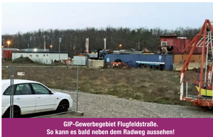
GIP-Gewerbegebiet Flugfeldstraße. So kann es bald neben dem Radweg aussehen!

gekostet. Für Zentrumsplanungen sind mittlerweile € 160.000 aufgegangen. Doch man kann keine Idee kaufen ohne sie zu verinnerlichen, ohne zu verstehen wie es zu dieser Idee kam, was ihr zugrunde liegt. So verkommen diese Pläne, es werden neue gemacht und wieder neue. Im Zentrum wird nun am